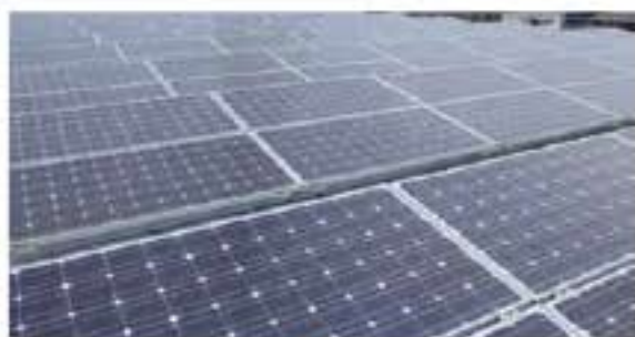
●弊社ソーラーパネル：2011年設置