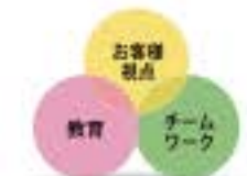
野水鋼業社員の、仕事への姿勢

営業の仕事は努力すればその結果が必ずついてくると思っています。お客さま一人ひとりに、工夫しながら野水鋼業の製品の良さを、自分の言葉、自分の感覚で伝えて行くことを一番に考え、実践していきます。 これからも、お客さま視点、教育、「チームワーク」を大事にしていきたいと思っています。